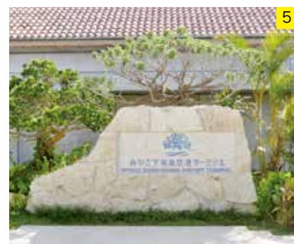
みやこ地下島空港ターミナル

今春、「みやこ地下島空港ターミナル」が開港しました。館内には、レストランやカフェ、特産品や限定商品を扱うショップなど見所満載。伊良部島や下地島へドライブしながら立ち寄ってみてはいかがでしょうか！