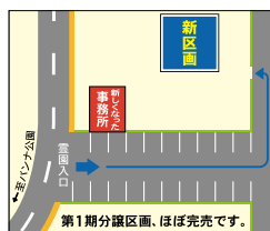
新区画は事務所や駐車場からも近い好立地

第1期同様、好立地な区画となっておりますので、皆さまのお問い合わせ、ご見学をスタッフ一同、心よりお待ちしております。