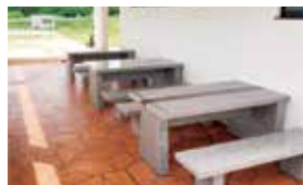
事務所には屋根付き休憩所も完備