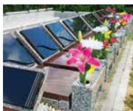
樹木葬「花想」も大好評

管理事務所から近く、広々とした休憩所やお手洗いもありとても便利で快適なお参りができます。