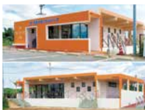
オレンジ色の外観が印象的な新事務所