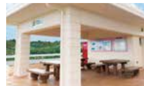
園内の高台にも休憩所をご用意