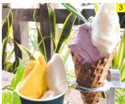
リッコ ジェラート RICCO gelato

「リッコ」とはイタリア語で「豊か」という意味。宮古島の豊かな食材を使って天然素材・無着色にこだわり、でき立てのジェラートを提供。定番から季節限定まで、90種のラインナップ。