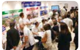
終活イベント活動

2015年 ● 終活支援センターにて「終活セミナー」初開催 (4月) ● 中城メモリアルパークに終活サロン「lively (リベリイ)」オープン (5月) ● 中城メモリアルパークにて「終活セミナー」初開催 (5月)