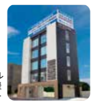
メモリアル終活支援センター