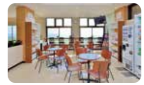
終活サロン「lively (リベリイ)」

2016年 ● 名護やんばるメモリアルパーク「おきなわ霊廟」完成 (4月) ● エンディング産業展2016(東京)出展 (8月)